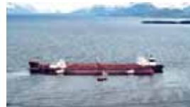
1989年3月24日 アラスカ湾で座礁