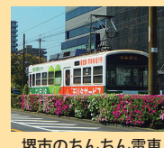
堺市のちんちん電車