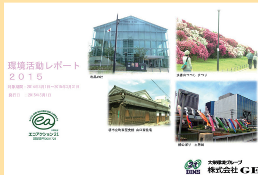
第19回環境コミュニケーション大賞 環境レポート部門大賞受賞 株式会社GE 環境活動レポート2015年度版（2015年5月発行）

大賞受賞により、私たちの環境取組が世間から高く評価されたことは、全社員に大きな自信と誇りとなりました。現場に笑顔が増えましたし、さらなる熱意をもって環境と安全活動に励んでいます。また、見学にお越しになるお客様との明るい話題作りにも役立っています。